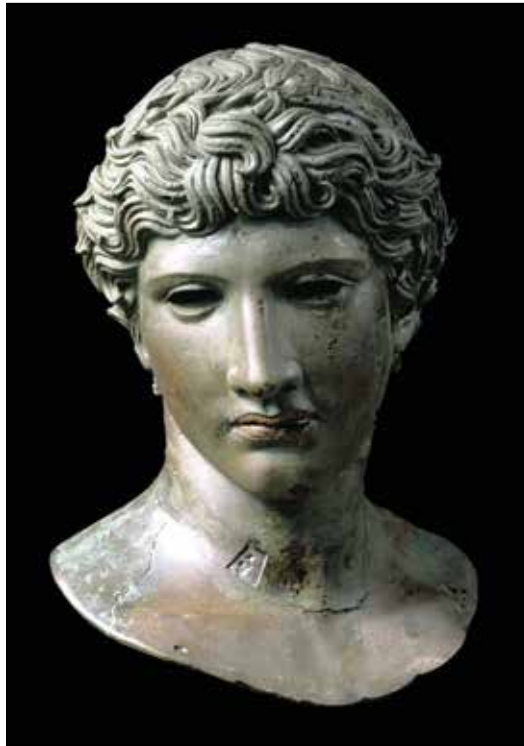
Foto: Biondini (arte greca, Musée du Louvre) - Foto ADN/Konias / Archivo Insieme.

■ Un carabiniere preoccupato incrocia un suo collega che gli domanda: