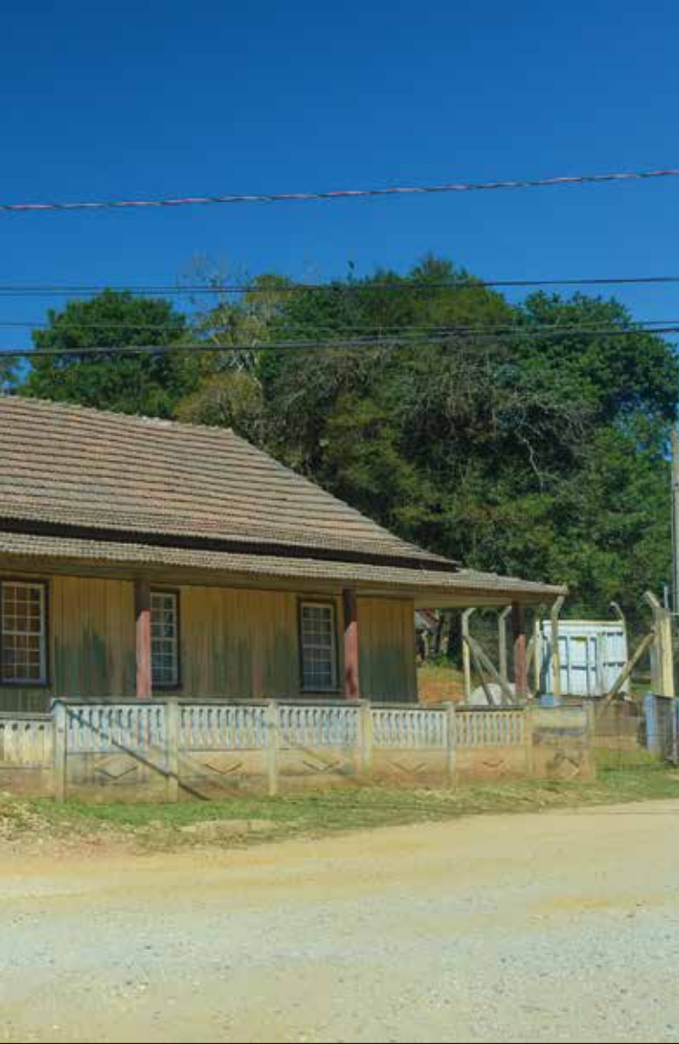
ORIELMO SOBREVIVENTE - COLÔNIA FÁRIA, COLOMBO-PR